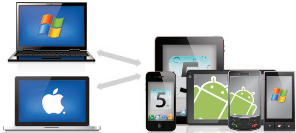
Fig 1 – Les administrateurs peuvent gérer les appareils mobiles depuis un Mac ou un PC

Avec Absolute Manage MDM, tous vos administrateurs peuvent être des spécialistes des appareils mobiles. Parce que la technologie Absolute Manage est conçue pour fonctionner aussi bien dans une infrastructure Windows que Mac. Vos administrateurs peuvent donc gérer tous les appareils depuis un Mac ou un PC et l'équipe peut partager le même jeu de compétences élargi.